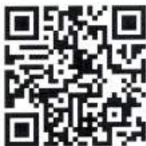
QR para registro de Estudiantes