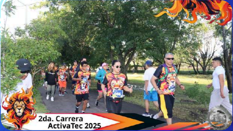
2da. Carrera ActivaTec 2025