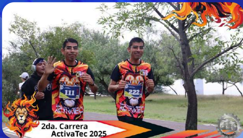
2da. Carrera ActivaTec 2025