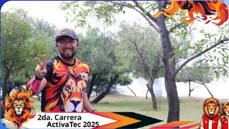
2da. Carrera ActivaTec 2025