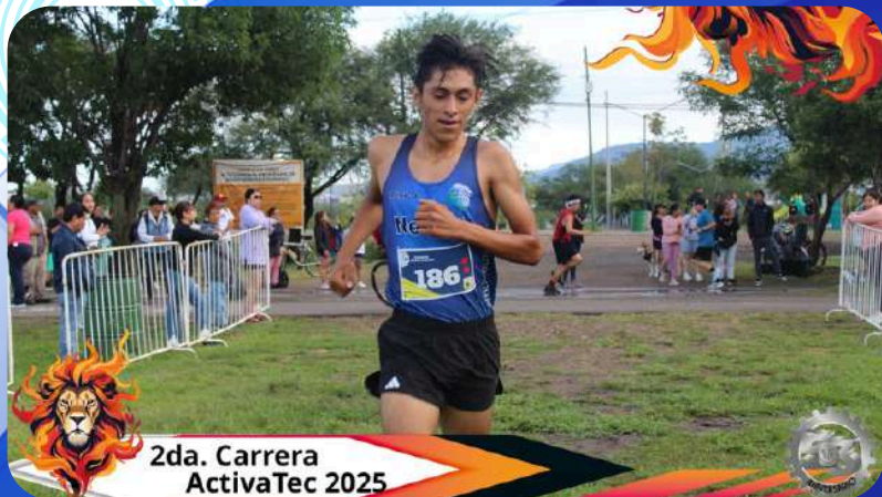
2da. Carrera ActivaTec 2025