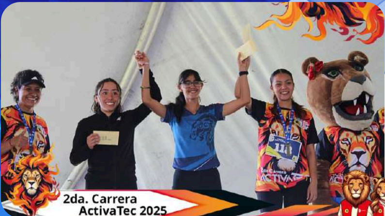
2da. Carrera ActivaTec 2025