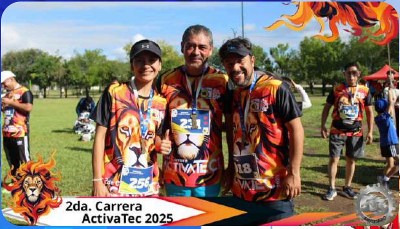
2da. Carrera ActivaTec 2025