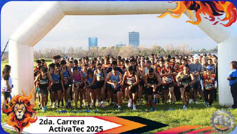
2da. Carrera ActivaTec 2025