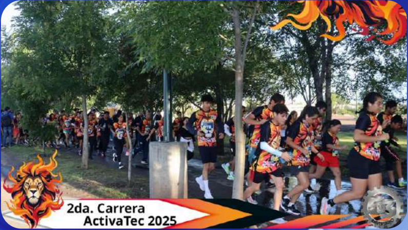
2da. Carrera ActivaTec 2025