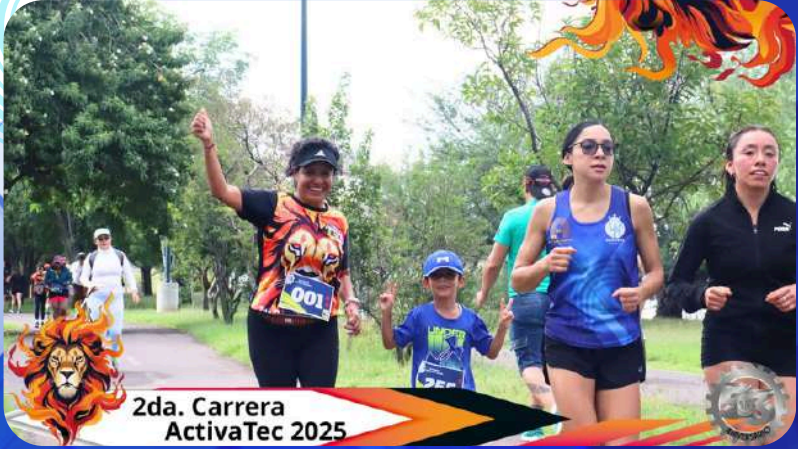
2da. Carrera ActivaTec 2025