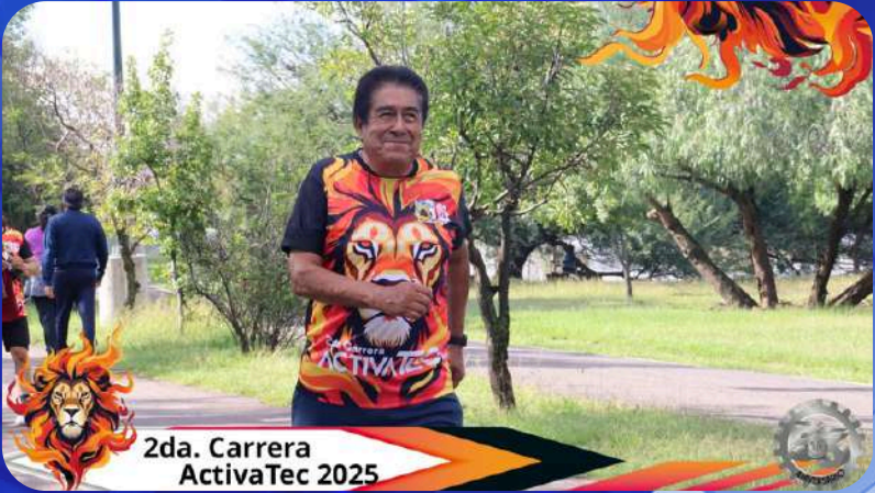
2da. Carrera ActivaTec 2025