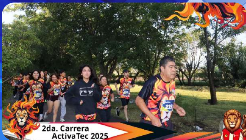
2da. Carrera ActivaTec 2025