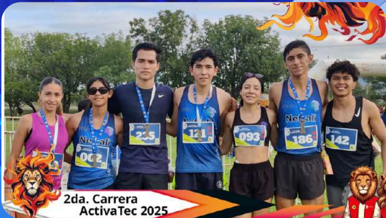
2da. Carrera ActivaTec 2025