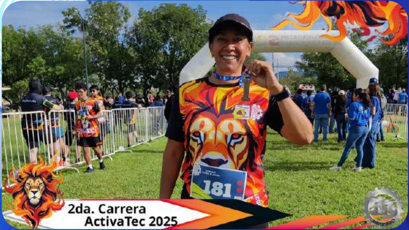
2da. Carrera ActivaTec 2025