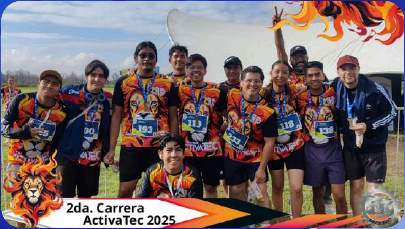
2da. Carrera ActivaTec 2025